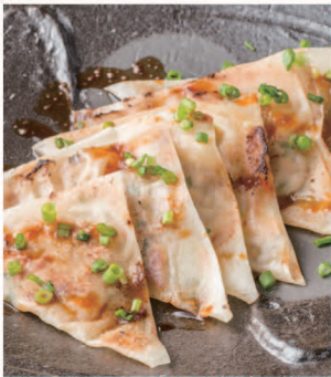
パリパリ鉄板餃子

デュワーズハイボール Dewar's Highball ¥450 (税込¥486)